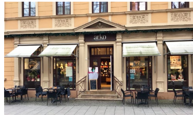
Mit neuem Leben gefüllt, die arko-Filiale in Weimar